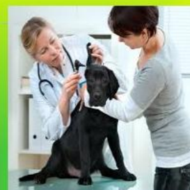
Врач - ветеринар