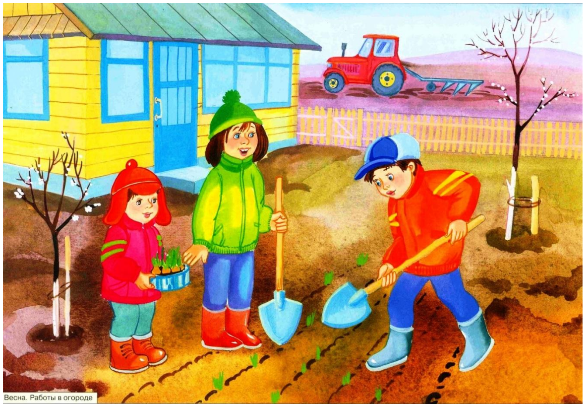
Весна. Работы в огороде