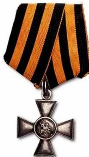
Орден Святого Георгия с Георгиевской лентой (Российская империя)

Исторически «Георгиевская ленточка» является наследницей Георгиевской ленты - двухцветной ленты к ордену Святого Георгия, Георгиевскому кресту или Георгиевской медали, которые служили военными наградами в Российской Империи.