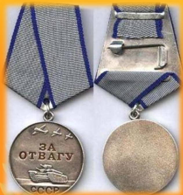
Медаль за отвагу

За героизм и подвиги на войне, солдаты награждались орденами и медалями.