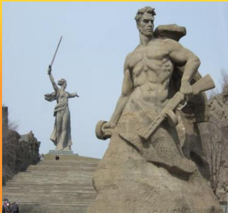
Мамаев Курган в Волгограде Монумент-