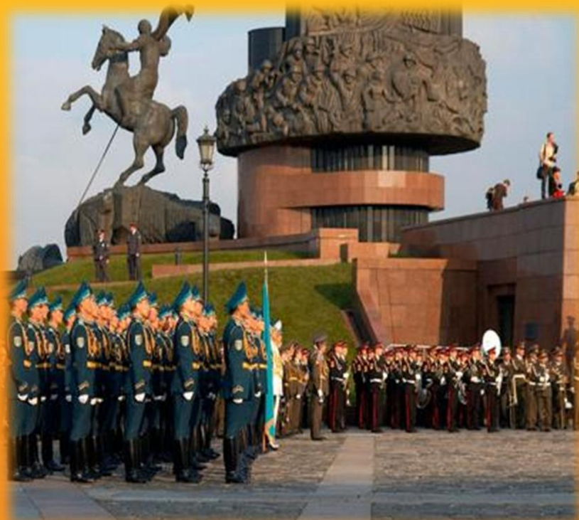
Поклонная гора в Москве