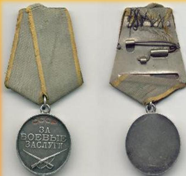
Медаль за боевые заслуги