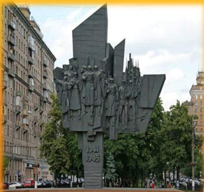
Монумент- «Защитники Москвы»