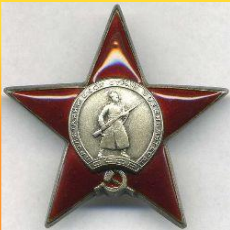
Орден красной звезды