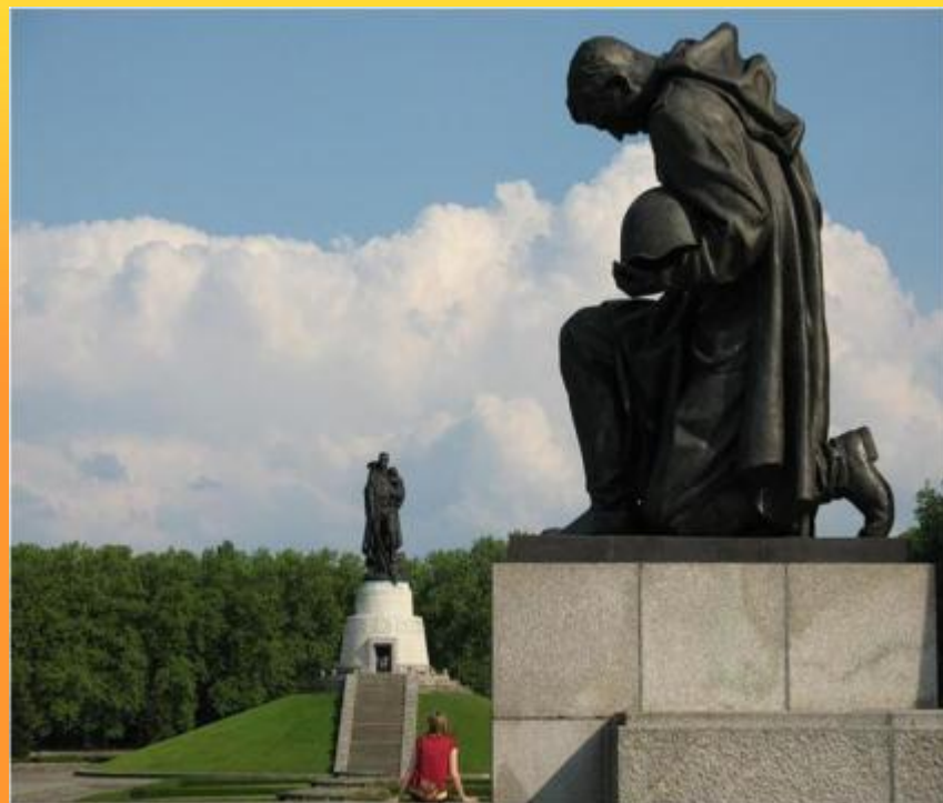
Памятник воинам Советской Армии павшим в боях с фашизмом.