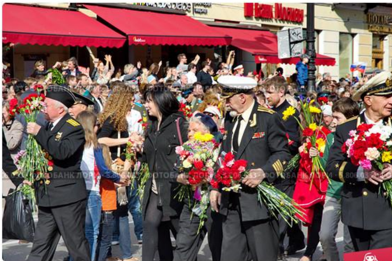
Шествие ветеранов Великой Отечественной войны, блокадников и т.д.